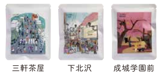
三軒茶屋 下北沢 成城学園前