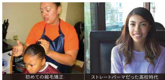
初めての縮毛矯正

19歳の時までヘアアイロンなどで縮毛矯正していたんです。お金も時間もかかるし楽しい時間ではなかったですね。